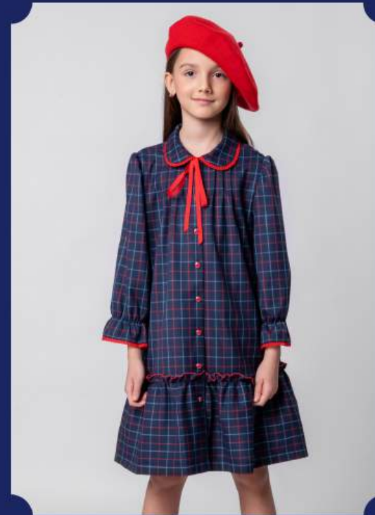
1. Платье-трапеция на пуговицах с лентой. Арт.7205234(Темно-синий)