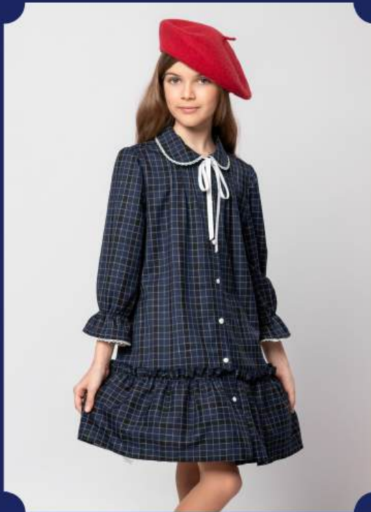
1. Платье-трапеция на пуговицах с лентой. Арт.7205234(Синий)