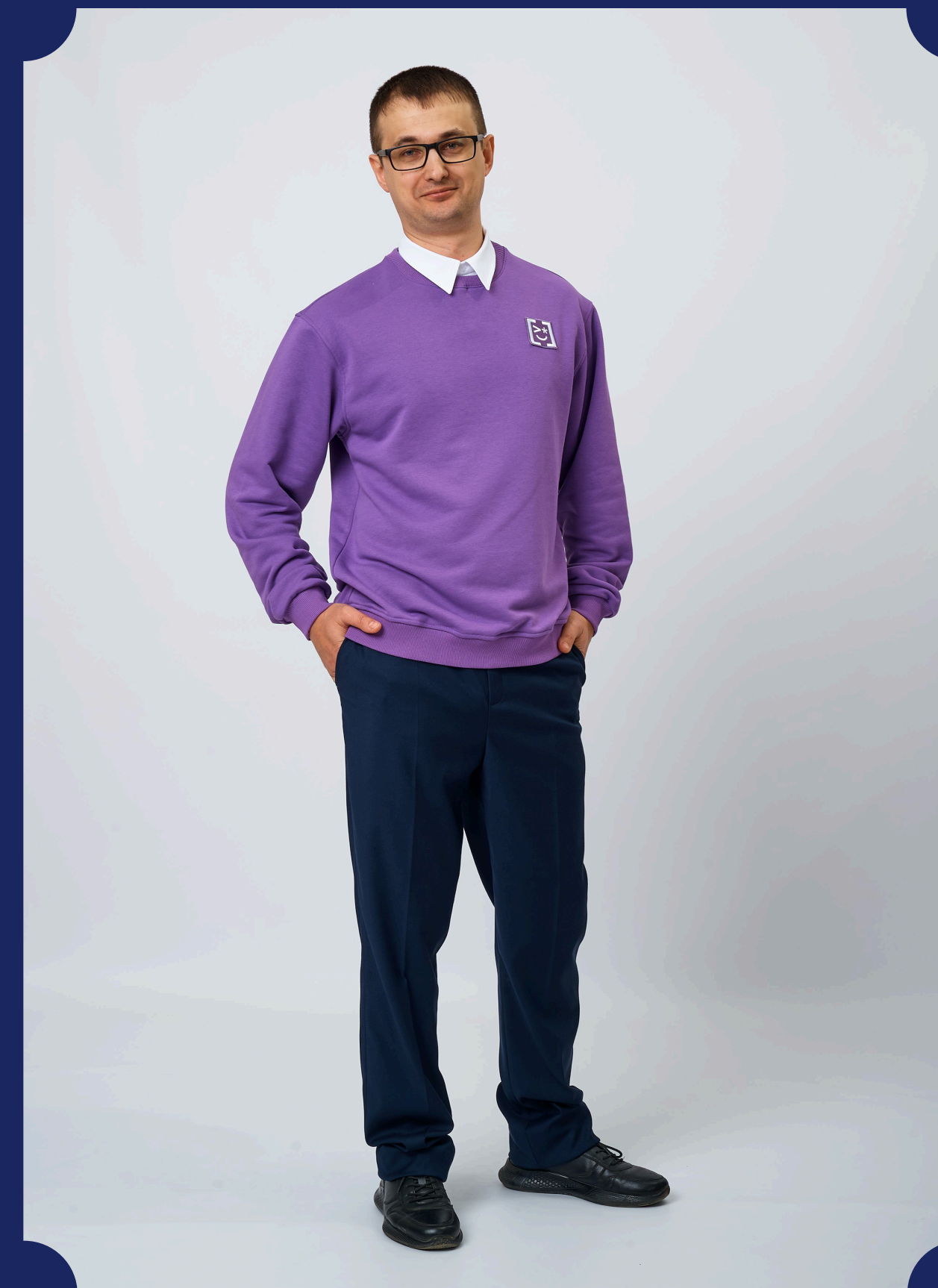
СВИТШОТ СО СЪЕМНЫМ ВОРОТНИКОМ