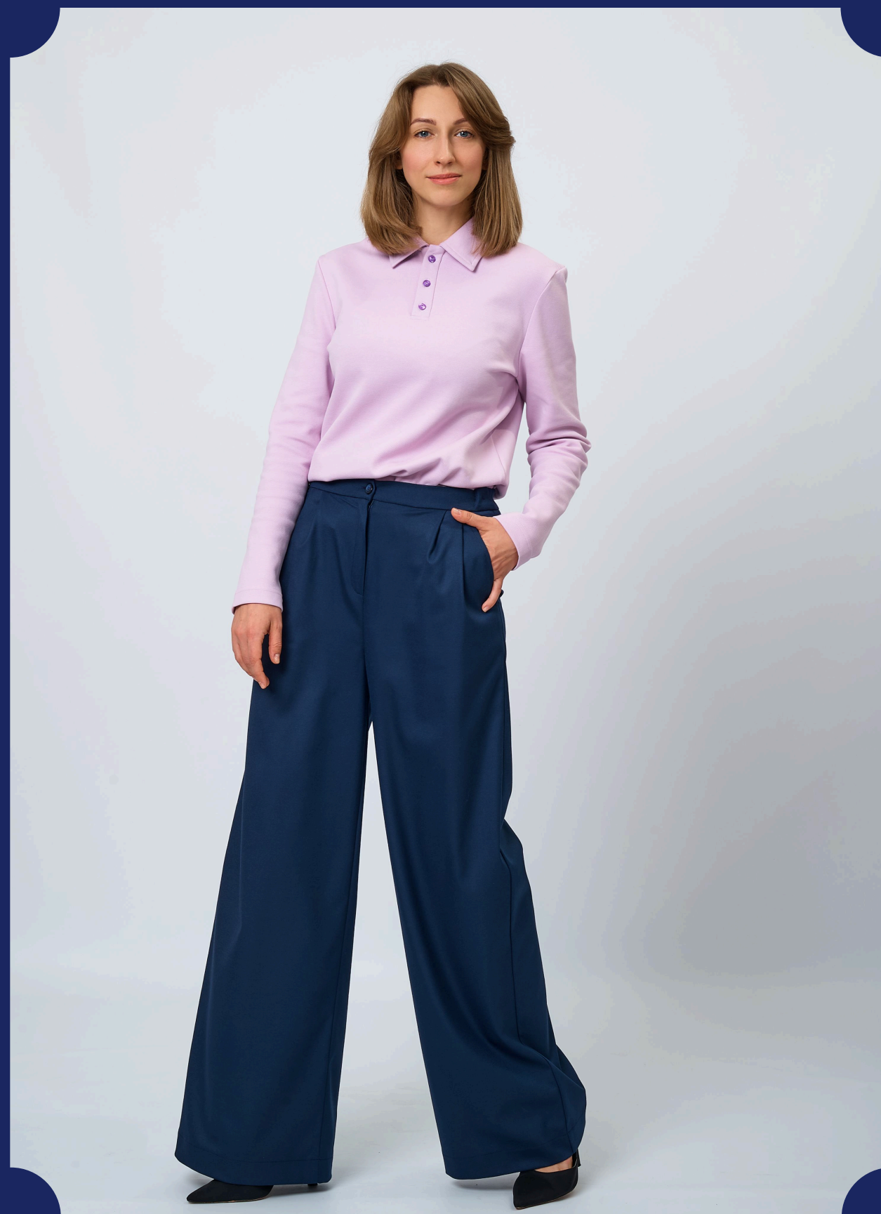
ПОЛО С ДЛИННЫМ РУКАВОМ УНИСЕКС