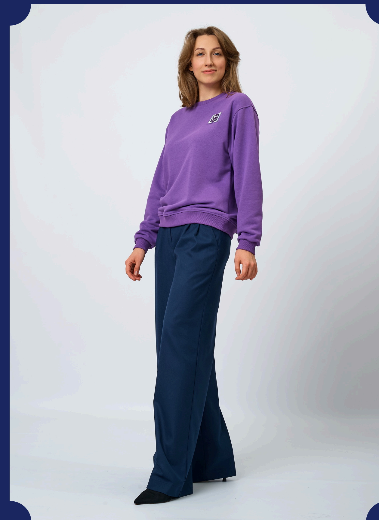
СВИТШОТ СО СЪЕМНЫМ ВОРОТНИКОМ