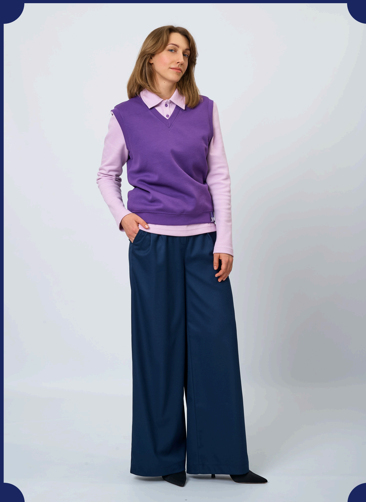
ПОЛО + ЖИЛЕТ