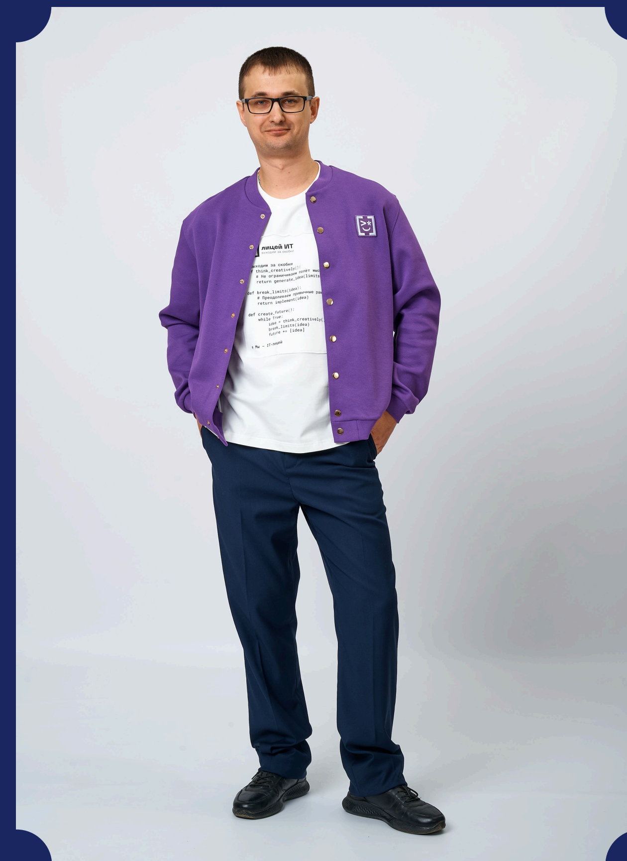
ФУТБОЛКА С НАШИВНЫМ ПРИНТОМ + БОМБЕР ИЗ ФАКТУРНОГО ТРИКОТАЖА